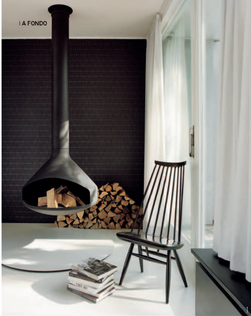
PROYECTO DE B&S ARCHITECTS. FOTO: BERGSDORF