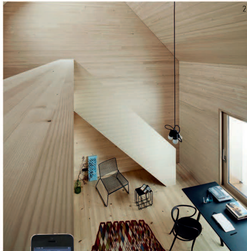
PROYECTO DE BERNARDO BADER.